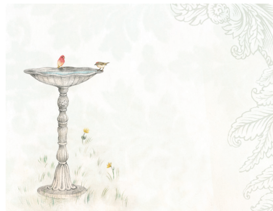
Dessin, photo ou image de l'oiseau